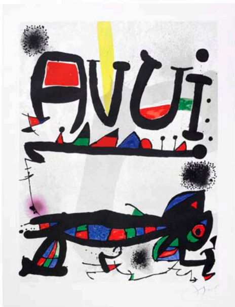
AVUI. © Successió Miró 2011