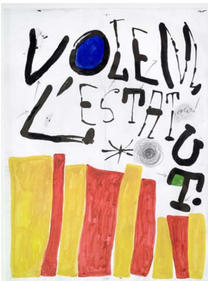
Volem l'Estatut. Successió Miró 2011