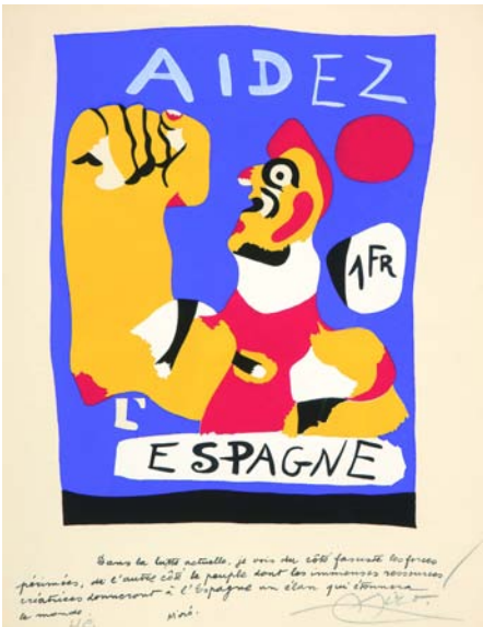
Aidez l'Espagne. © Successió Miró 2011