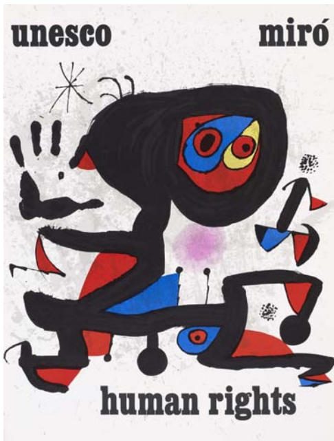
Unesco Miró Human rights. © Successió Miró 2011