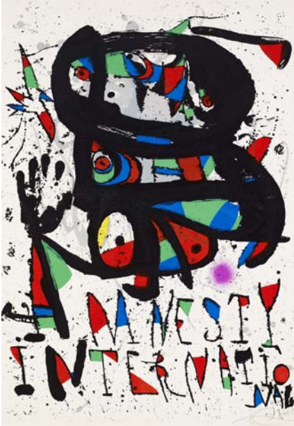
Amnesty International. © Successió Miró 2011